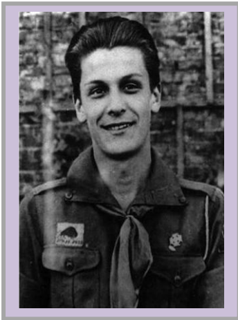
Maciej Aleksy Dawidowski, ps. Alek

Jan Bytnar, ps. Rudy, Maciej Aleksy Dawidowski, ps. Alek i Tadeusz Zawadzki, ps. Zośka - harcerze z Szarych Szeregów, członkowie Wawra, absolwenci liceum Batorego. Mieli po dwadzieścia kilka lat, gdy walczyli z okupującymi Polskę Niemcami w ramach Małego Sabotażu. Uczestniczyli w wielu akcjach bojowych i dywersyjnych Kedywu KG AK. Przyjaźnili się ze sobą i byli gotowi oddać jeden za drugiego życie, czego najlepszym dowodem była akcja pod Arsenalem 26 marca 1943 r.,